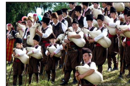
Dudelsack-Festival in den Rhodopen

Abendessen und Übernachtung im 3*** Hotel im Stadtzentrum.